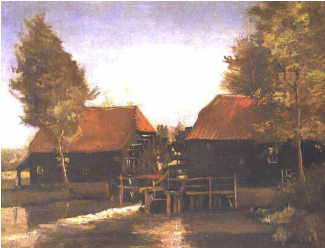
Peinture de Van Gogh, 1884. ©

En 1884 Vincent van Gogh a peint le moulin à eau.