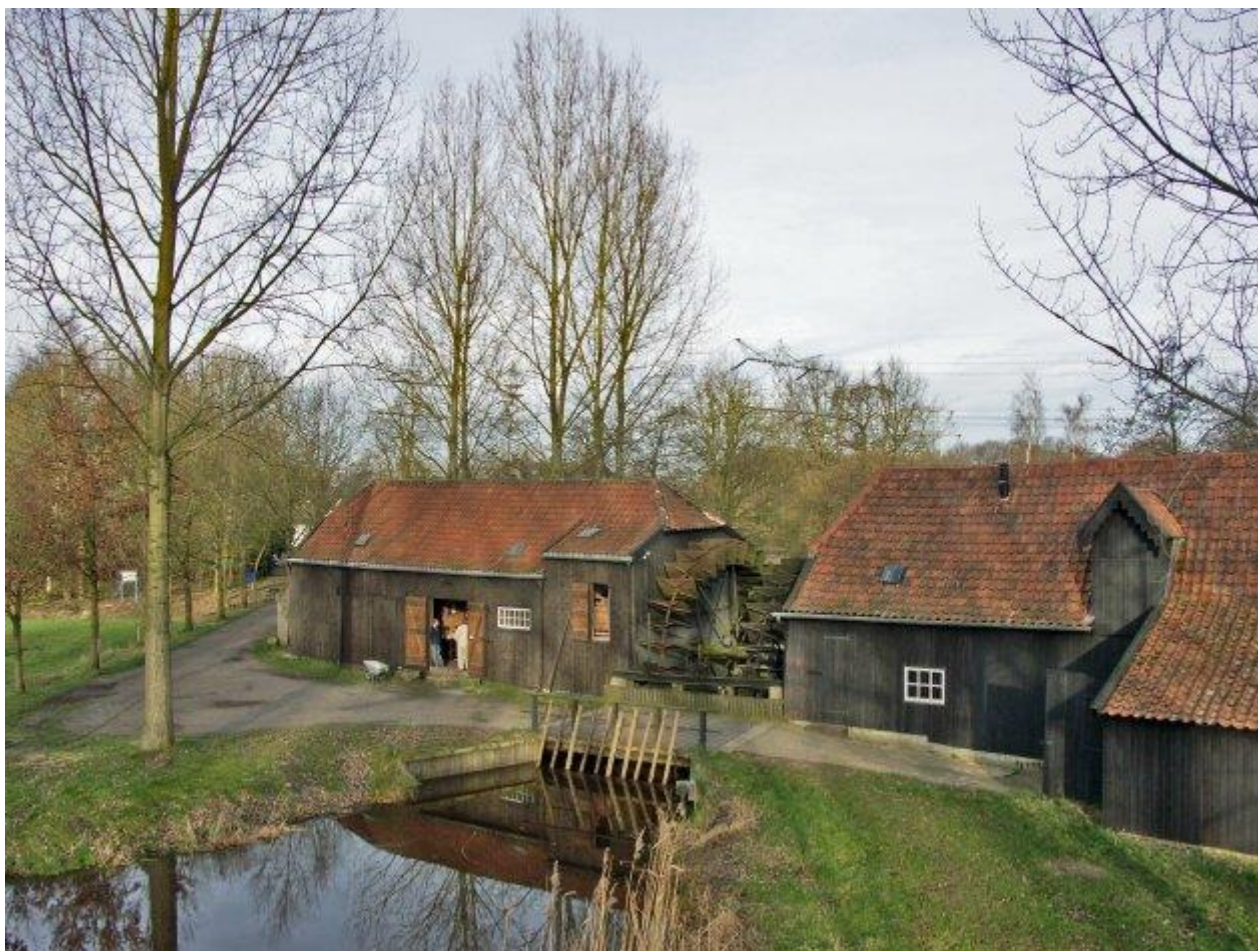
Le moulin à eau de Coll avec ses deux roues et ses toits de tuiles rouges. © Photo: Norbert van Eekeren, Nuenen, feb. 2007 Vue du côté sud.